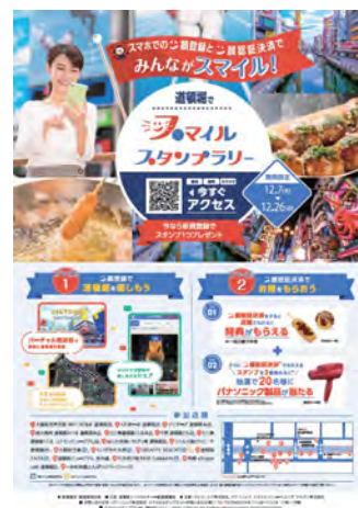
▲ポスタービジュアル